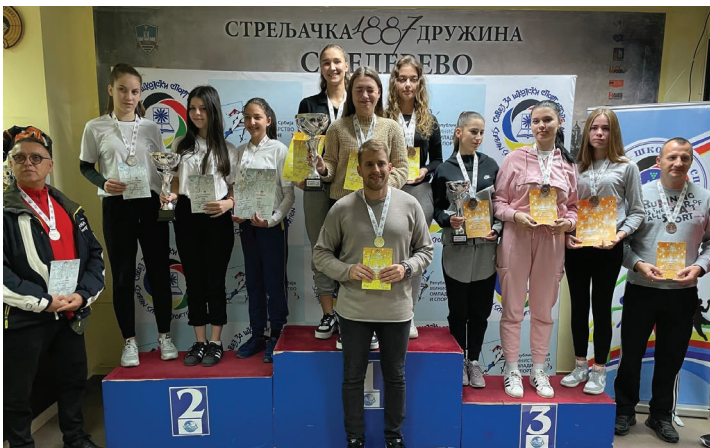
Теодора Утвић Гимназија Смедерево

ПРВО МЕСТО у мушкој конкуренцији, код средњошколаца заузела је екипа из Горњег Милановца , а наша екипа репортера је имала прилику да их интервјуише и сазна да су они по трећи пут државни прваци и да су победу очекивали. У женској конкуренцији прво место су заузеле девојке из Смедеревске Паланке. Атмосфера је била сјајна, такмичари су се међусобно дружили и понели дивне успомене са такмичења.