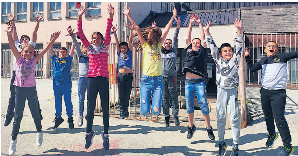
ОШ „Драгиша Луковић Шпанац” Крагујевац

Н ама, осмацима, ближи се крај школске године. Ту је, на дохват руке. Као и сваке године у ово време, можда само нешто пре, креће трка за оценама. Наставници кажу да је ово редовна дисциплина и да ђаци размишљају о оценама и школи тек када дође на ред закључивање. Можда су у праву. Изгубили смо осећај и за рад и за оцењивање. Прижељкујемо омиљено “гледање кроз прсте и питамо се заслужујемо ли то?”