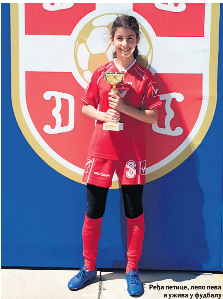
Ређа петице, лепо пева и ужива у фудбалу

- Ако нешто волите, без обзира дали се то другима свиђа, вероваћете у себе и наставићете до свог циља. Ја се ни у једном случају ни бих сло-