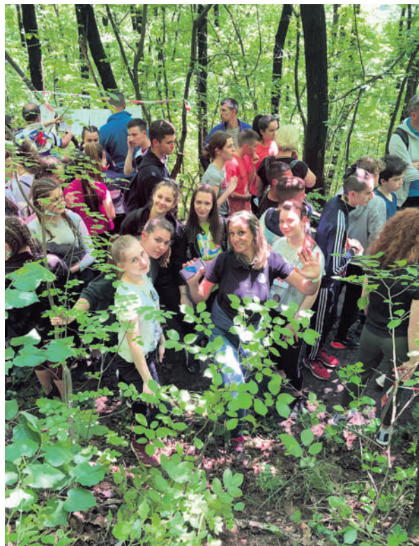
Учествовало је 254 такмичара