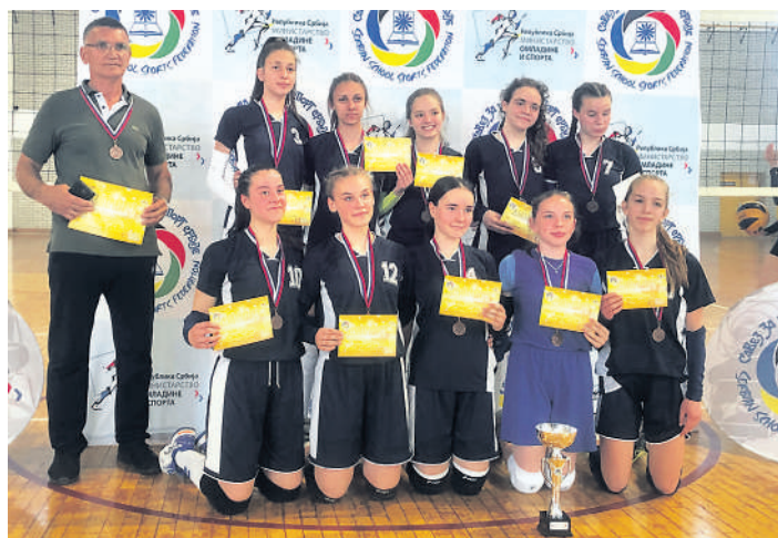
Циљ је остварен - бити међу најбоље три школе у Србији

ШКОЛСКО ДРЖАВНО ПРВЕНСТВО У ОДБОЈЦИ ЗА ОСНОВНЕ И СРЕДЊЕ ШКОЛЕ