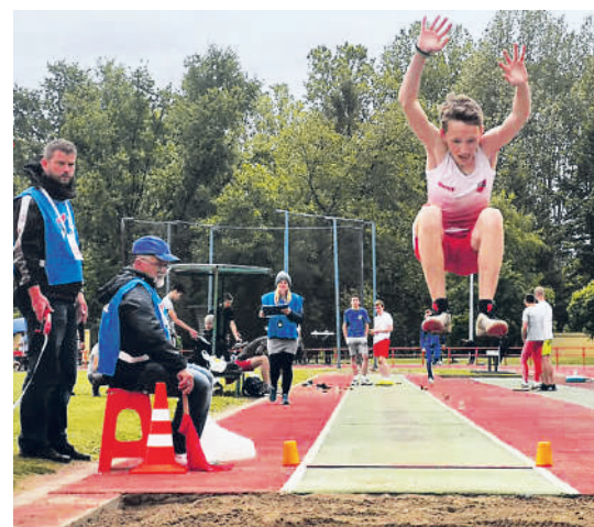
Скок до школске медаље

ШКОЛСКО ДРЖАВНО ПРВЕНСТВО „ЗДРАВО РАСТИМО“ АТЛЕТСКИ КУП ОДРЖАН У СРЕМСКОЈ МИТРОВИЦИ