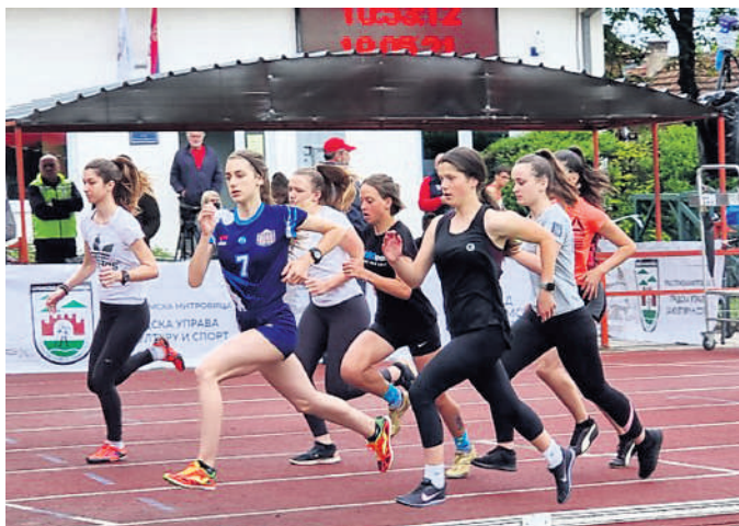
Ни временски услови нису могли да утичу на такмичаре