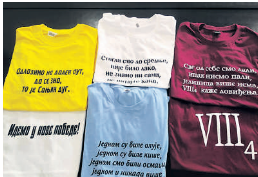
Популарне матурантске мајице, ОШ „Херој Иван Мукер” Баничина, Смедеревска Паланка

Књига нам је никад даља, а мисли лутају много брже и више него раније. Да ли да неправедно окривимо пубертет или да, ипак, преузмемо одговорност? Збрка у мислима једнака је празнини у знању. Кулонов закон, ваљак, карбоксилна киселина, Други крсташки рат, Wh реченице... Видите ли како ово хаотично звучи и само док се чита? Нисам од оних ђака којима тешко пада учење новог градива, али сада, ове године, мало сам успорио и треба ми убрзање. Радо бих рестартовао ову школску годину и кренуо изнова, да на време ухватим залет. Наставници имају разумевања и тек по неко има веће замјерке на наше учење, споминућу, свима добро знане, „лење бубе”. Углавном, нису строги и надам се да ће такви остати до краја. А вама, драги моји другари осмаци, же-