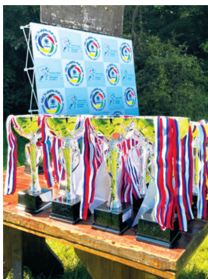
Пехари и медаље спремни за најбоље

ма и квалификовали се на државно првенство које је одржано на Авали, девет дана касније.