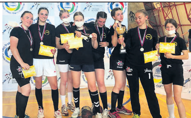
Одличан рукомет виђен је у конкуренцији ученица

ШКОЛСКО ДРЖАВНО ПРВЕНСТВО У РУКОМЕТУ ЗА ОСНОВНЕ И СРЕДЊЕ ШКОЛЕ