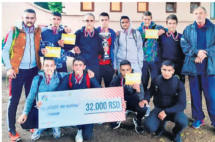
Тријумф школе „Наталија Нана Недељковић” Крагујевац, Грошница