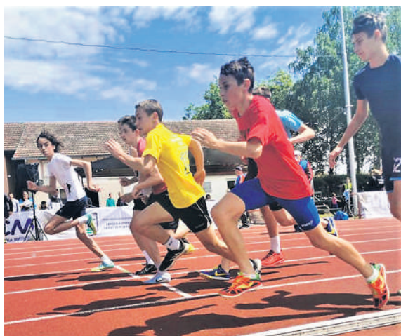
Атмосфера је била сјајна, пуна добре енергије, великих надања и амбиција