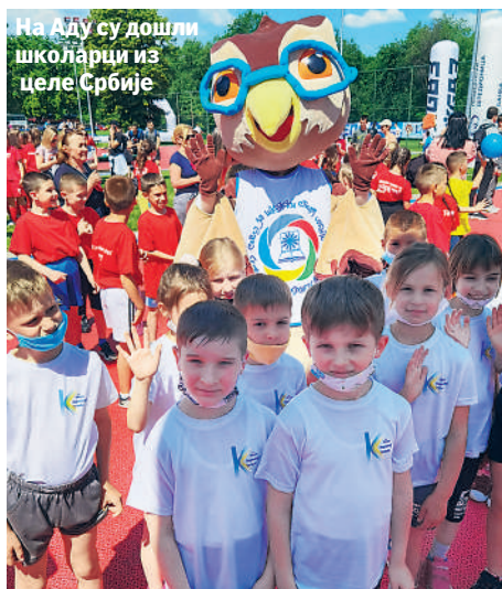
На Аду су дошли школарци из целе Србије