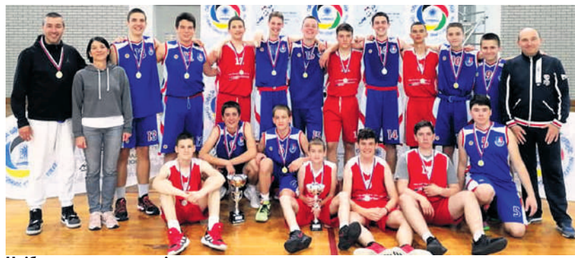
Најбољи у конкуренцији основних школа

У доба пандемије и изолације, спорт је спона која повезује наше најталентованије ученике и мотивише их. Чак ни вирус није спречио младе спортисте да покажу такмичарски и спортски дух и дају свој максимум у борби за државног првака. Овогодишња државна првенства у екипним спортовима одржана су у Кладову, градићу на крајњем истоку наше државе. Државно првенство у кошарци одржано је од 31. маја до 4. јуна 2021. године. Финалне утакмице одигране су у Спортској хали „Језеро“.