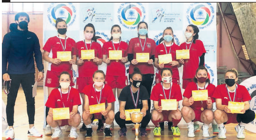
Неизвесни мечеви обележили су борбу за медаље