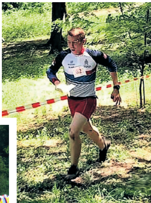
Стаза је била захтевна због лошег времена

Оријентиринг, спорт у коме су физичка снага и снага ума подједнако важне, спорт за мале и велике авантуристе, сналажљиве, домишљате и упорне. Управо у оваквом спорту, ђаци наше гимназије су имали прилику да први пут одмере снаге крајем априла. Све недоумице које су такмичари имали су нестале, а у тврђаву су ушли брзим кораком, сигурни и спремни да дају све од себе. У среду, 12. маја године, споменути кандидати још једном су тестирали и доказали своје вештине упркос лошим временским услови-