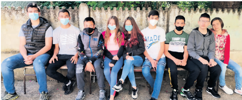
Хуманитарни матуранти ОШ „Ђура Јакшић” Јовац

Готово сви матуранти на крају године штампају мајице са својим именима и натписима по жељи, које носе сви заједно последњих дана у школи. Искрено, оне не коштају баш мало... Ученици Основне школе „Ђура Јакшић” у Јовцу једногласно су одлучи-