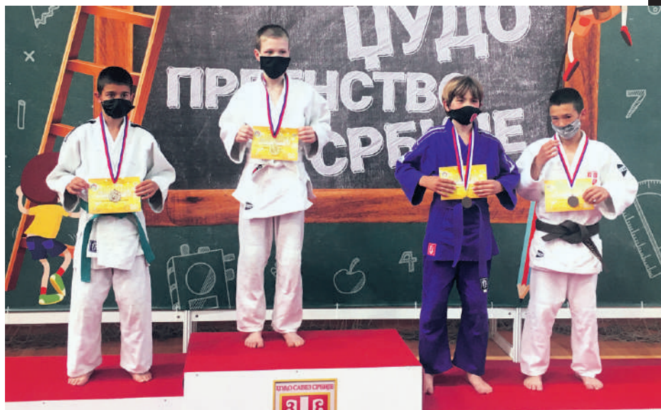
Утисак са Државног првенства је узбуђење због коначног повратка такмичења

учио да је сваки пораз добра школа. Добио сам нови мотив и већ сада се спремам да победим противника од којег сам изгубио.