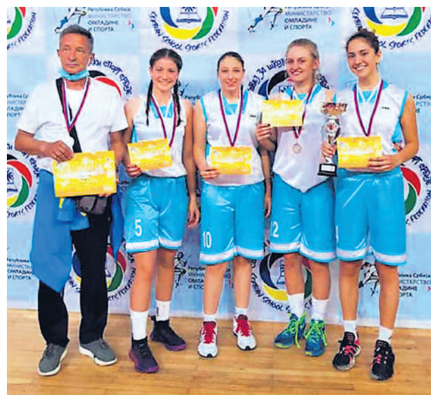
Баскеташице на висини задатка