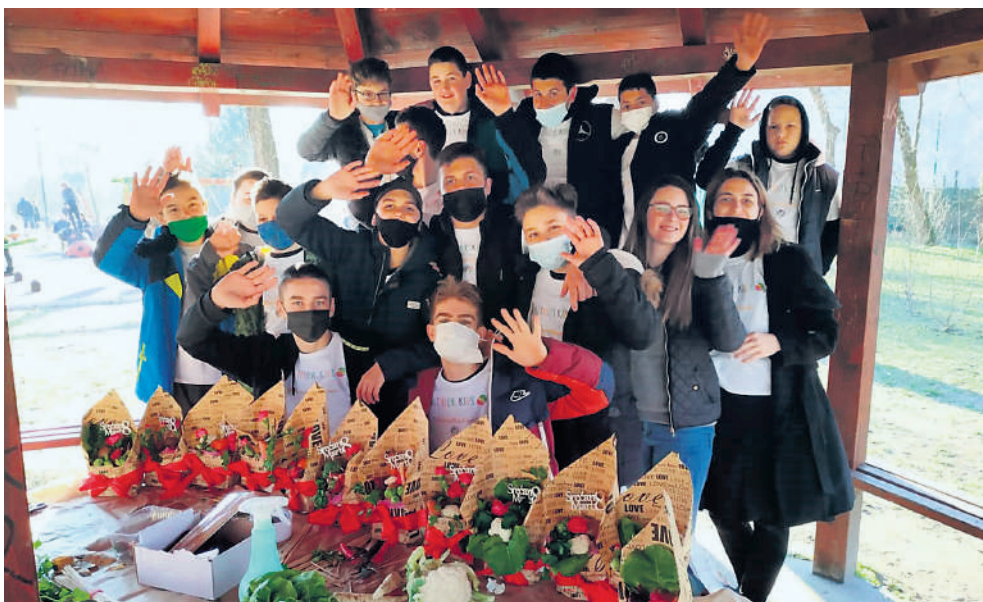
Радионица Здрава тајна: ОШ „Сечењи Иштван“ Суботица