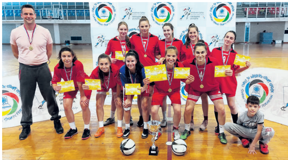
Титула за гимназију „Јован Јовановић Змај“ Нови Сад

Државно првенство у фудзалу за средњошколце одржано је у Спортској хали „Језеро“ у Кладову 20. маја. Финалну утакмицу су играли ученици школског центра „Никола Тесла“ из Вршца и ученици Хемијско-технолошке школе из Суботице. Убедљиву победу понели су Вршчани резултатом 8:3 и тако заслужено понели државни пехар. За треће место су се борили ученици