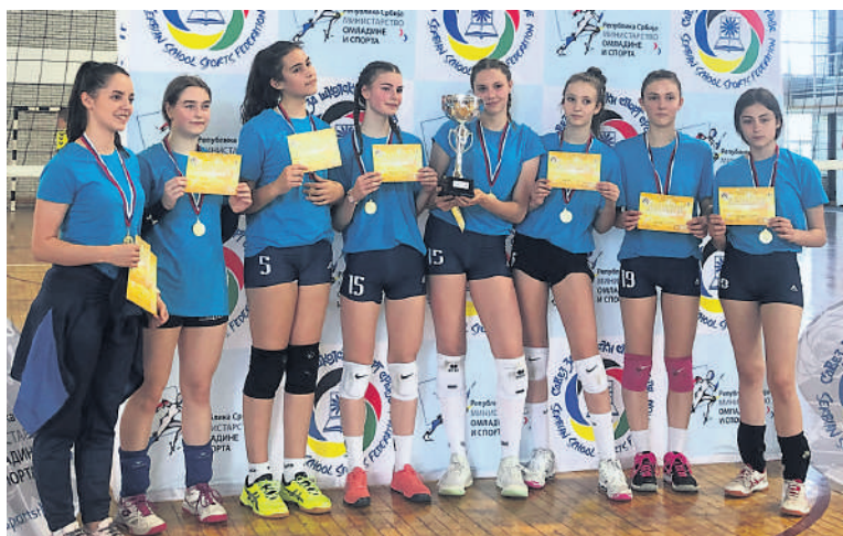
Много разлога за славље у Кладову