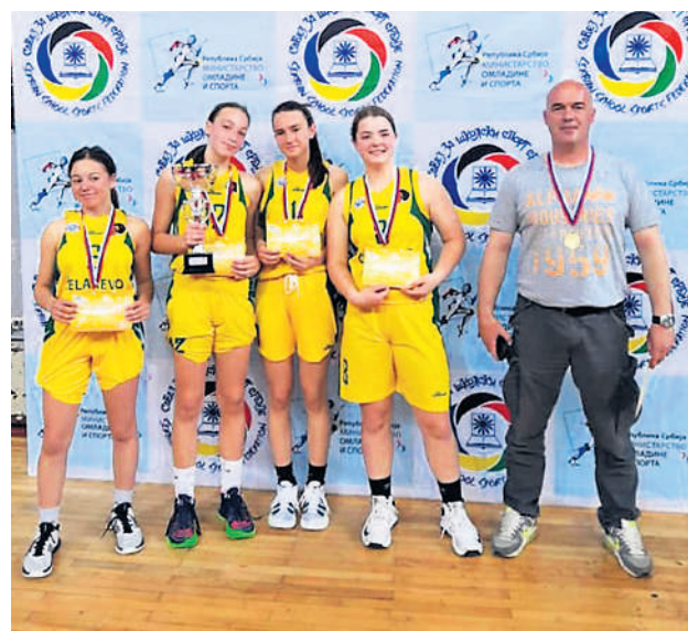
Понос због оствареног резултата