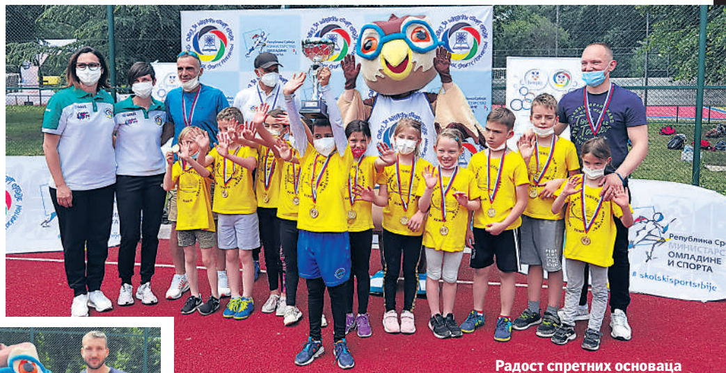
Радост спретних основца