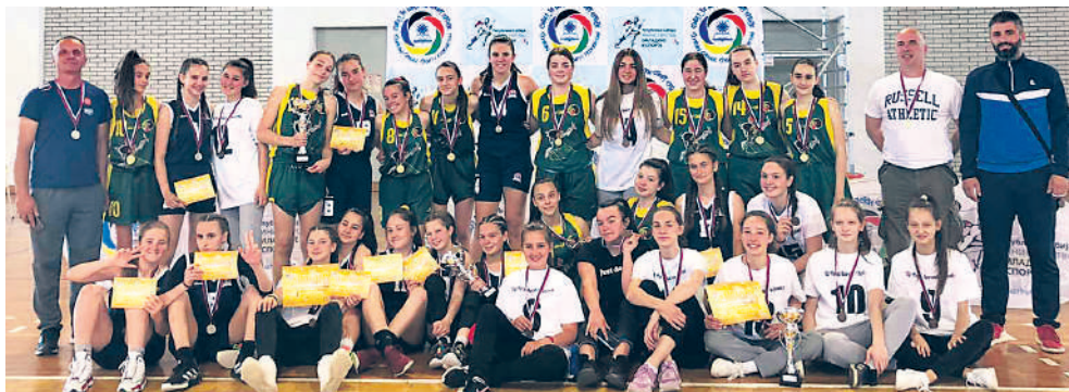
Освајачице медаља у кокуренцији основних школа

У конкуренцији кошаркашица, у финалу су се наше ученице ОШ „Здравко Челар“ из Челарева и ученице ОШ „Херој Радмила Шишковић“ из Смедеревске Паланке. Девојчице из Челарева су биле боље и са