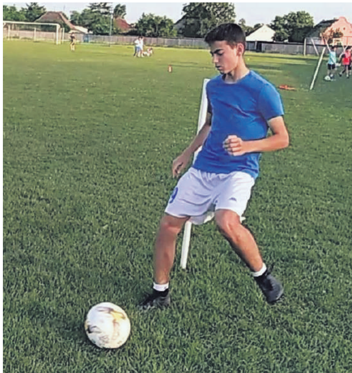
Фудбал тренира већ 12 година

ВАЖНИЈИ МИ ЈЕ СПОРТ ОД ДРУШТВЕНОГ ЖИВОТА. ДРУШТВЕНИ ЖИВОТ МОЖЕ ДА ЧЕКА