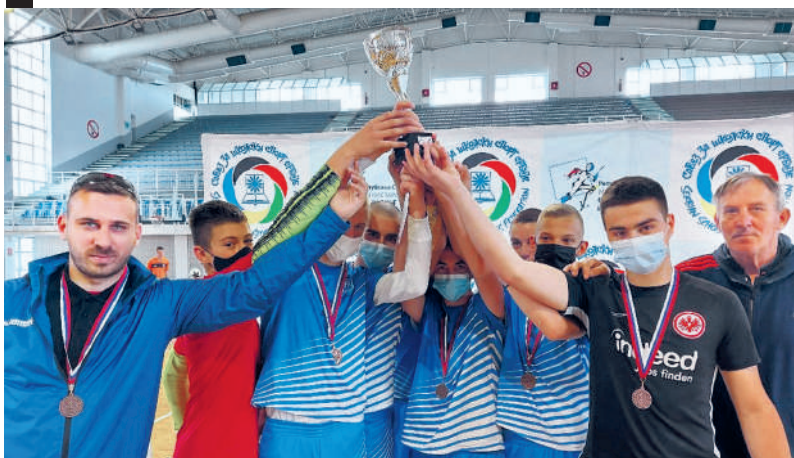
Тријумф у мечу за треће место