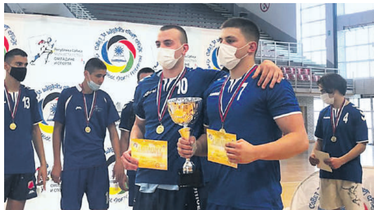
Титула за ученике гимназије „Јован Јовановић Змај” из Новог Сада

Премијерни наступ имале су основне школе. Учествовало је по осам екипа у мушкој и женској конкуренцији. Дечаки из ОШ „Браћа Груловић” из Бешке освојили су прво место и титулу првака државе. Они су у узбудљивој утакмици са поеном разлике 19:18 победили другопласирану екипу из ОШ „Младост” из Пригревице, док су трећепласирани екипа ОШ „Жарко Зрењанин” из Зрењанина, који су са пет поена разлике 14:9 победили ученике ОШ „Др Јован Цвијић” из Смедерева.