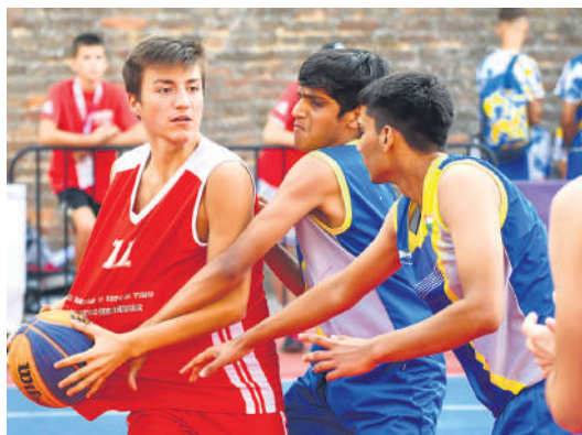
Баскет 3x3 привукао је велику пажњу

Како се ближио крај такмичења у Београду, све чешће се поставља-