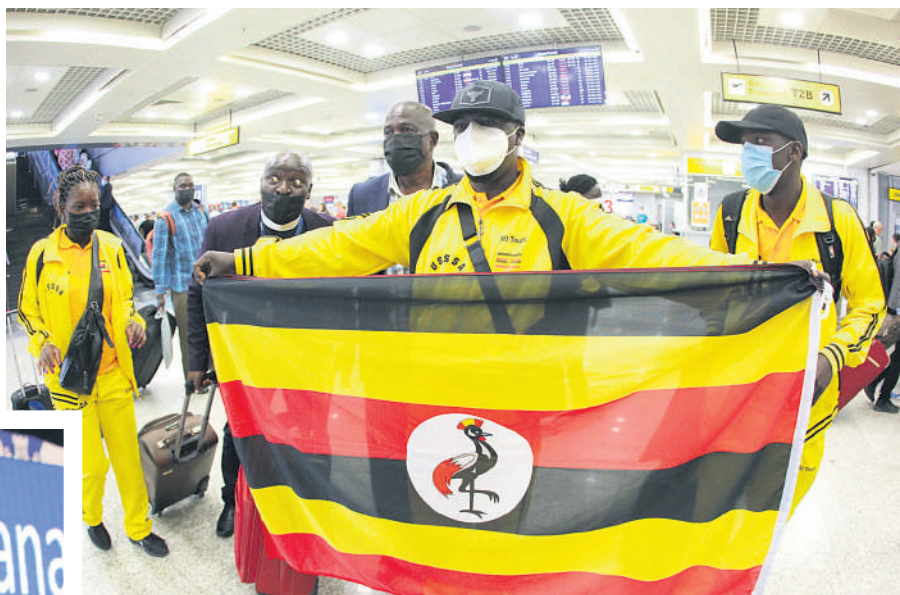
Београд је угостио учеснике из чак 36 државе