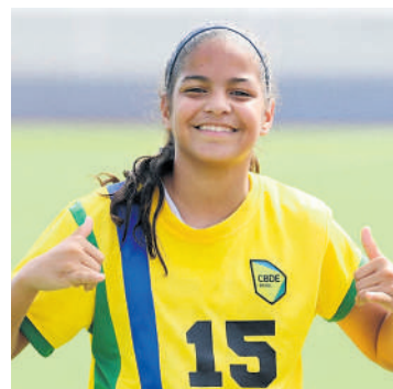
Бразил је још једном показао зашто је земља фудбала