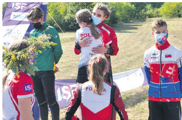
На Школаријади је обележн Дан Оријентиринга

ло питање ко ће бити организатор наредних Игара. На Свечаном отварању, застава ИСФ је пренета Бразилу, који ће 2023. организовати такмичење под називом ИСФ У15 Гимназијада. Бразилу неће бити лако да надмаши Београд, с обзиром да ће ових шест такмичарских дана у Србији још дуго одјекивати светом, јер су деца кући понела много незаборавних тренутака, много нових лекција и безброј нових пријатељстава.