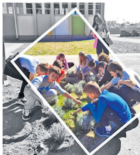
Акција сејање невена и одржавања већ посађених садница лаванде

говца која су у дружењу и спортским такмичењима себи обезбедила дан за памћење. Поучени народном мудрошћу да лепа реч и гвоздена врата отвара, ученици трећег разреда су своје поруке пријатељима качили на балоне које су пуштали у нади да ће стићи у праве руке.