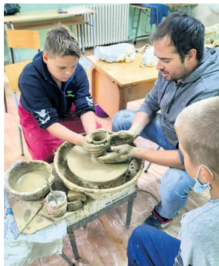
У Дечијој недељи тестираш и своју креативност