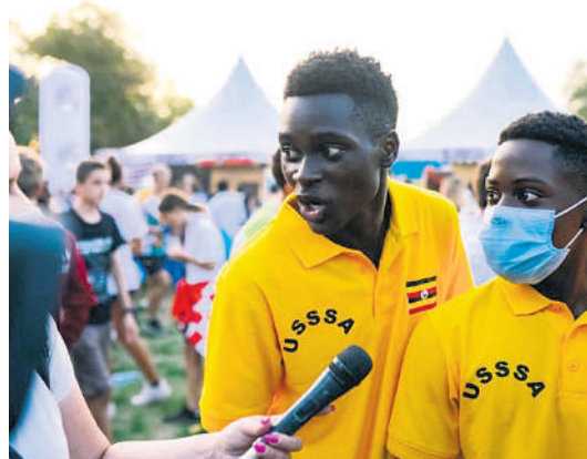
Такмичари су били пуни утисака

је можда и најважније јесте да су деца из Београда отишла срећна, задовољна и здрава. Није било позитивног теста, по одласку из Србије. Да није било ситуације са пандемијом вируса, сигуран сам да би имали пре-