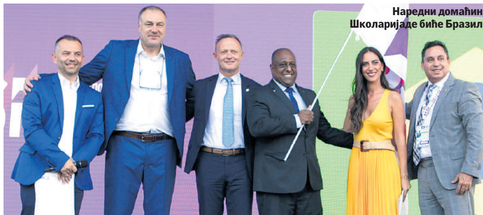
Наредни домаћин Школаријаде биће Бразил

„У СКЛАДУ СА ОДЛУКАМА КРИЗНОГ ШТАБА И ОДРЕДБАМА ВЛАДЕ РЕПУБЛИКЕ СРБИЈЕ СВИ УЧЕСНИЦИ ШКОЛАРИЈАДЕ КОЈИ СУ ДОПУТОВАЛИ У СРБИЈУ, БИЛИ СУ У ОБАВЕЗИ ДА ПРИЛИКОМ УЛАСКА У ЗЕМЉУ ПРИЛОЖЕ НЕГАТИВАН ПЦР ТЕСТ“