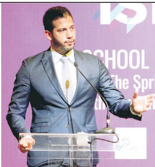
На великом форуму о школском спорту говорили су и потпредседник Владе и министар просвете Бранко Ружић и министар омладине и спорта Вања Удовичић

„УЗ ТАКМИЧЕЊА БИЛО ЈЕ И ПУНО ДРУГИХ АКТИВНОСТИ, У ПРВОМ РЕДУ ТУ ЈЕ БИО ВЕЛИКИ ФОРУМ О ШКОЛСКОМ СПОРТУ“