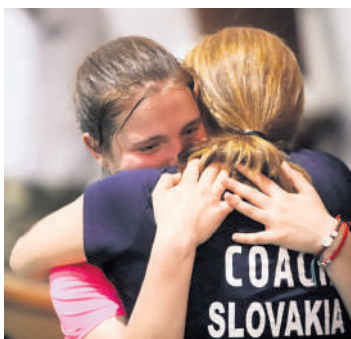
Много емоција, радости, али и туге

„УЧЕСНИЦИ ПРВЕ, ИСТОРИЈСКЕ ШКОЛАРИЈАДЕ ТАКМИЧИЛИ СУ СЕ У АТЛЕТИЦИ, БАДМИНТОНУ, КОШАРЦИ, БАСКЕТУ 3x3, ШАХУ, ФУДБАЛУ, ЦУДОУ, КАРАТЕУ, ОРИЈЕНТИРИНГУ, ПЛИВАЊУ, СТОНОТЕНИСУ, ТЕКВОНДУ, РВАЊУ И ОДБОЈЦИ“