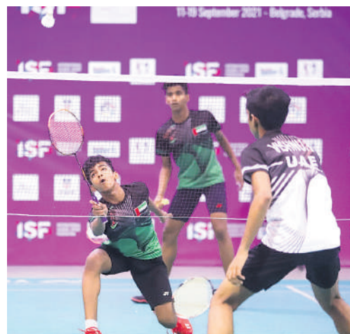
Ко ће бити највештији, најбржи, најсрећнији... и тако у 14 спортова