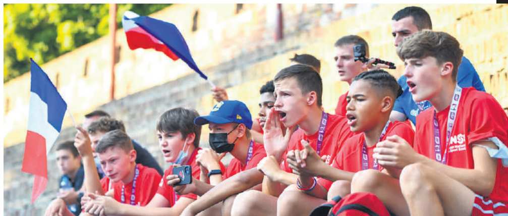
Док су чекали да изађу на терен, такмичари су бодрили ривале