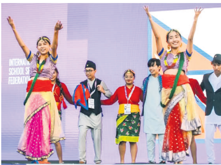
Веча нација је традиционалан догађај на свим такмичењима у организацији ИСФ-а

По статистикама, по броју учесника, у последњих десет година у Србији није било већег догађаја. ИСФ је саопштио да је по броју освојених медаља најуспешнија Украјина (149), Србија је друга са 111, Словачка је трећа са 53 док је Русија четвртопласирана са 42 освојене медаље. Занимљив податак је и да су спортисти из чак 32 државе освојили медаље. Србија је