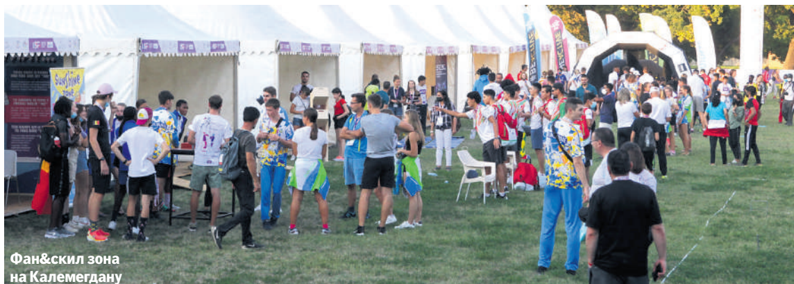
Фан&скил зона на Калемегдану

- Веома је забавно, можеш да испробаш разне спортове и имаш