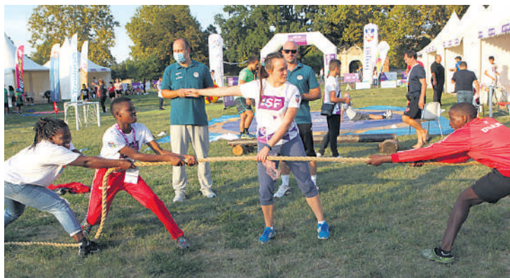
Различити типови активности на Фан&скил зони

Цео овај пројекат је донео нешто ново за свакога од нас, осим игара имали смо и посебан програм где смо сви заједно играли и певали, као и наступ ватрене виолинисткиње која је све оставила без даха.