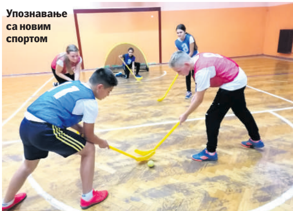
Упознавање са новим спортом

ову лепу манифестацију обележиле су разноврсне активности (штафета, такмичење у најлуђој фризури и шминци, гледање филма и представе, креативне радионице, посета грнчара...). Ученици наше школе су веома вредни и радо учествују на разним конкурсима. Један од успешних конкурса је био поводом манифестације 36. Дана лудаје у Кикинди. На овом конкурс, освојена су прва места на литерарном и ликовном конкурс.