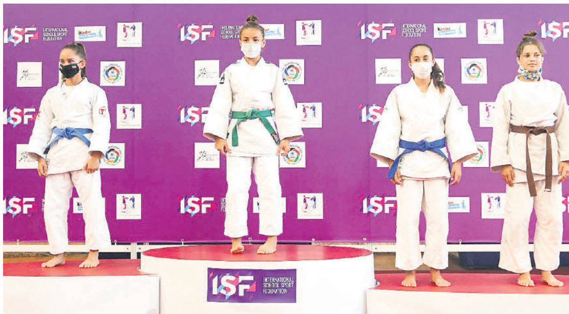
Освојити медаљу је био циљ који је покретао већину такмичара на Школаријади