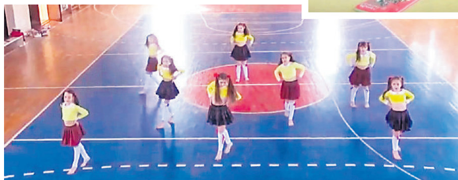
Освојиле су друго место по броју лајкова и прегледа на друштвеним мрежама

да је то није ништа тешко, да смо ми само изашли, одиграли било шта, снимили и тек тако победили. Али није тако.