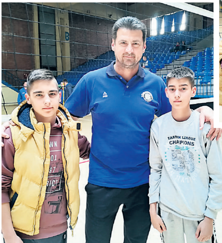
Никада неће заборавити Вањине савете

- Највећи успех наше одбојке, освајање олимпијског злата, есио се 2000. године у Сиднеју када ја још нисам био рођен. Као мали дечак слушао сам од родитеља о невероватној игри и успеху наше репрезентације. Финални меч против Русије преприча-