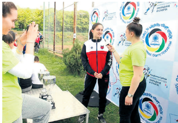
Александра у разговору са ђаком репортером

Иако је стаза изгледала лакша него претходне године, такмичарима је требало скоро duplo више времена да је пређу