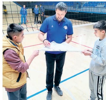
Аутограм на дресу као талија