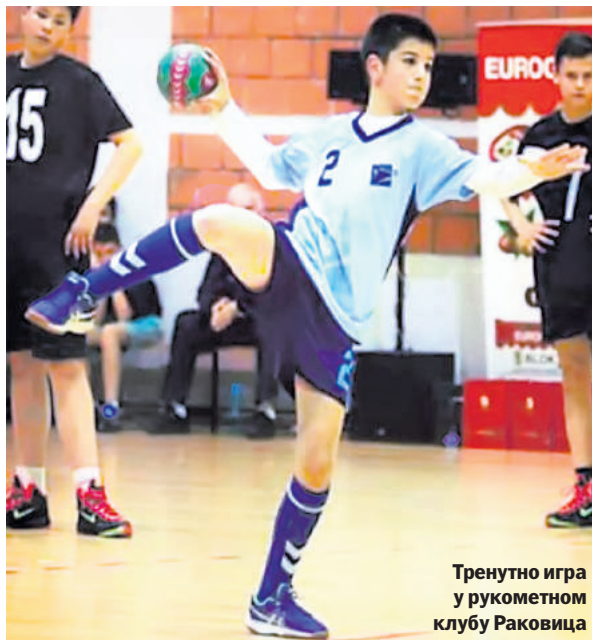
Тренутно игра у рукометном клубу Раковица

Захваљујући преданом раду постао је много успешан. Врхунац његове досадашње каријере био је тренутак када је позван да наступа за репрезентацију Србије. Био је веома