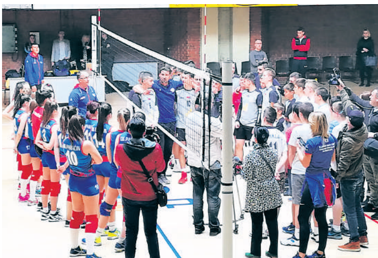
Мале тајне великог мајстора