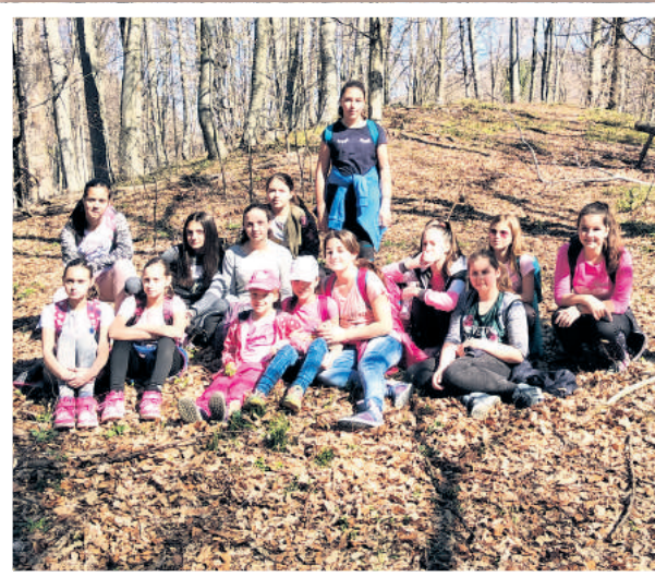
Мириси, цвркулт птица и дечија граја су обележили ову шетњу

УЧЕНИЦИ ИЗ КРУШЕВЦА КРЕНУЛИ У СВОЈУ ТРАДИЦИОНАЛНУ ПРОЛЕТЊНУ АВАНТУРУ