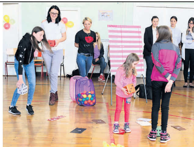
Кроз игру се негује сарадња, блискост и љубав између свих чланова породице

Правила ове игре одређују породице према узрасту своје деце. Реквизити се не купују већ се праве. Распореду се поља са бројевима и натписима у занимљиву стају, поставе се картице са порукама у путањи стазе, сваки играч добије по једну велику коцку. Креће се од поља СТАРТ, и иде се до ЦИЉА, уз доношење одређеног објекта - у овој