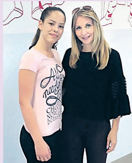
Наставница Ивана у друштву ђака репортера

- Драго ми је да се види и осећа колико обожавамо свој позив, са каквим еланом радим и колико је човек срећан када ради оно што воли, али ми је ово признање и велика обавеза да са истим ентузијазмом наставим да радим, да се лично усавршавам и самим тим покушам да будем још боља и креативнија.