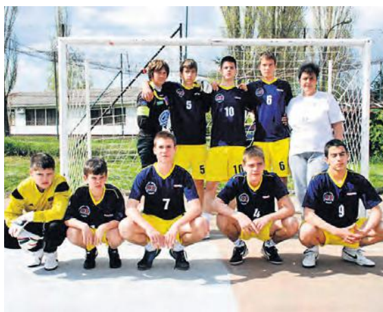
Фудбалери ОШ „Петефи Шандор“

Уколико погледамо учинак школа у прошлој години и једноставно саберемо један и један добићемо следећи резултат – две школе из Новог Сада, једна основна и једна средња, су без премца и с пуним правом заслужују прво место. Основна школа „Петефи Шандор“ и гимназија „Јован Јовановић Змај“ најбоље су у Србији рачунајући бодове освојене у свим спортовима, на свим степенима такмичења у школском спорту.