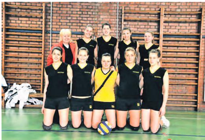
Одбојкашице гимназије „Светозар Милетић“