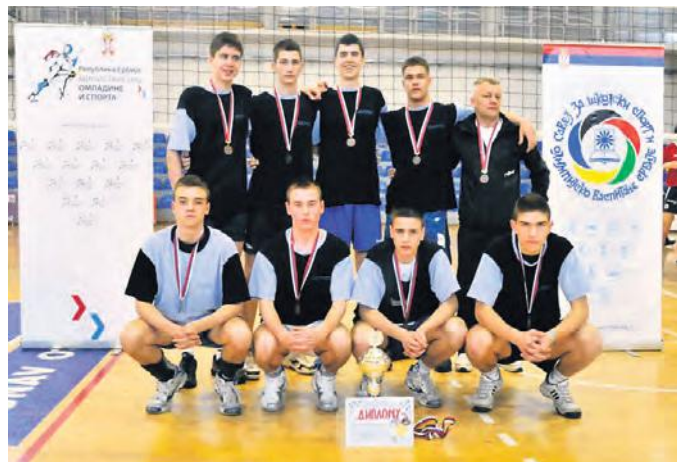
Кошаркаши гимназије „Светозар Милетић“