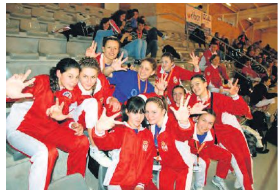
Рукометашице гимназије „Среван Сремац“

средњих школа са 46.000 ученика, који се током школске године такмиче у десет спортова. Сва такмичења у игри са лоптом се организују по систему лига, па се тако у четири лопташка спорта у току године одигра између 600 и 700 утакмица. Такмичења су изузетно масовна- мали фудбал броји 40, кошарка 56, рукомет 45, а одбојка 50 екипа. Поред редовних активности, Савез за школски спорт града Ниша организује велики број окружних, међоокружних, републичких и квалификационих првенстава за одлазак на светска првенства.