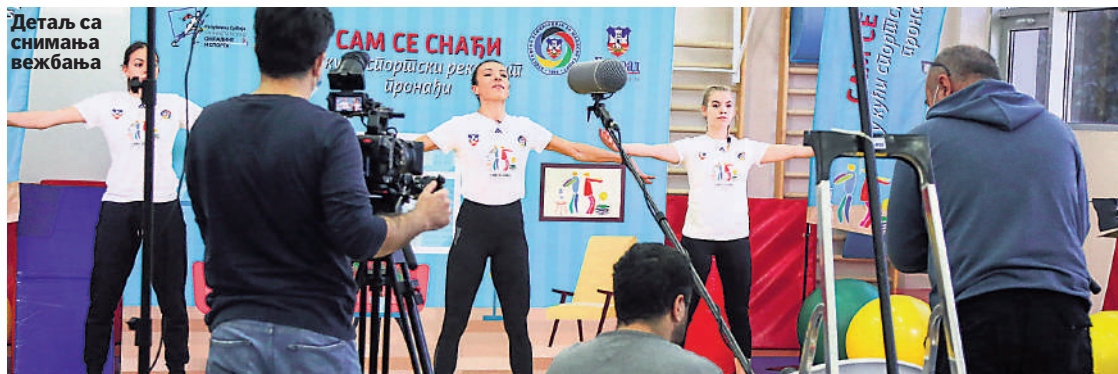
Детаљ са снимања вежбања