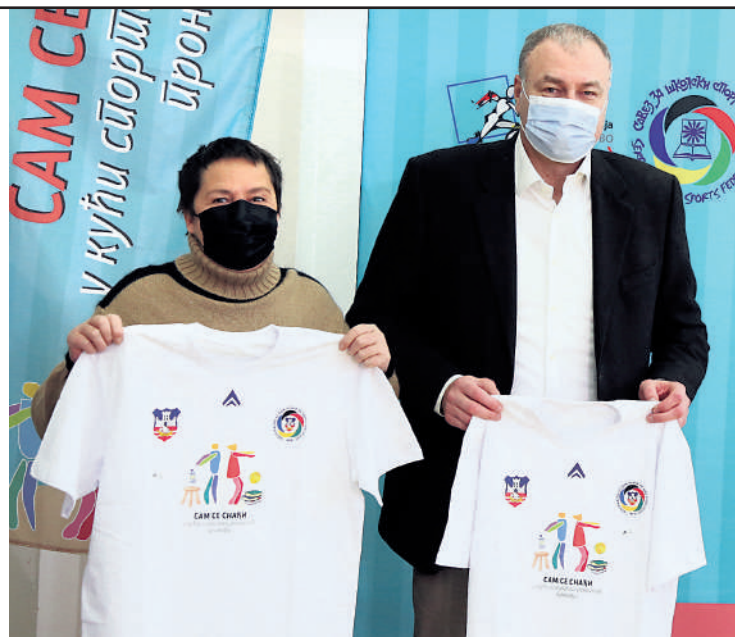
Савез за школски спорт Србије и Београдска асоцијација за школски спорт покренула су заједно пројекат

У оквиру овог пројекта, био је отворен и конкурс за ученике „Реквизит и вежба споји и награду освоји“. Конкурс је подразумевао да ученик/ца уз стручне савете свог наставника физичког васпитања осмисли и сними модел вежбања код куће од различитих вежби са или без реквизита. Најбоље програме вежбања Комисија Савеза за школски спорт Србије наградила је вредним наградама