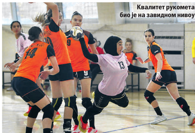
Квалитет рукомета био је на завидном нивоу