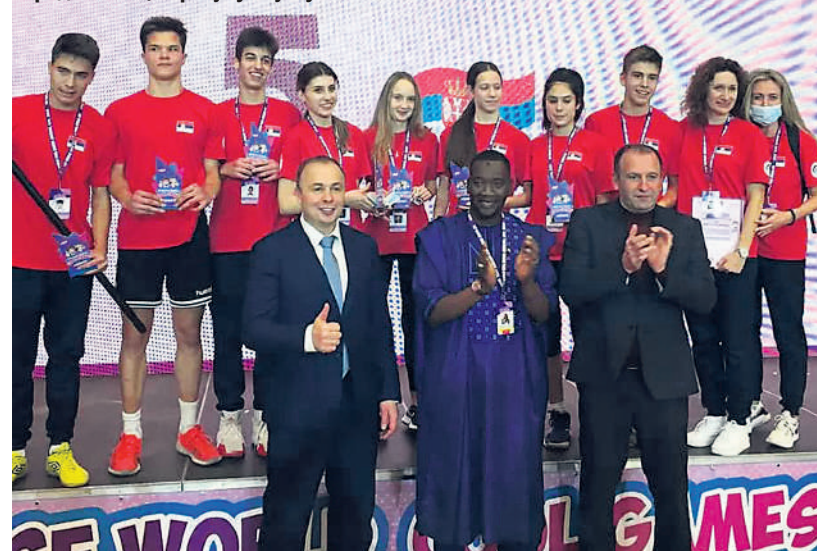
Представници Србије у Кијеву

ло. Трудили смо се да искористимо сваки моменат. За време припрема и током такмичења међусобно смо се упознали, зближили и стекли многа нова познанства. Првог дана смо се такмичили у мешовитим екипама и тада смо први пут добили прилику да разговарамо са осталим учесницима и заједно прођемо кроз све полигоне. Можда бити сам у екипи са странцима звучи страшно, али сви су били