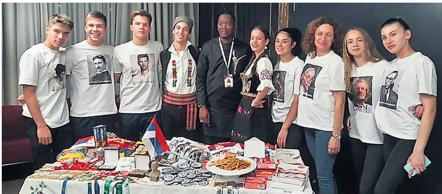
На вечери нација, наши представници у мајицама са сликама истакнутих Срба

лепо расположени, атмосфера је била пријатна, пријатељска. Сутрадан, на дан правог такмичења, био је присутан такмичарски дух, али су се све екипе међусобно подржавале. Најзанимљивији део такмичења био је када је члан нашег тима приликом демонстрације полигона стао на место главног судије и имитирао га. Овај духовити поступак прихватиле су судије и организатори. Инспирисани њиме, организовали су полигон у коме су се такмичили професори и судије, а деца су имала улогу судија.