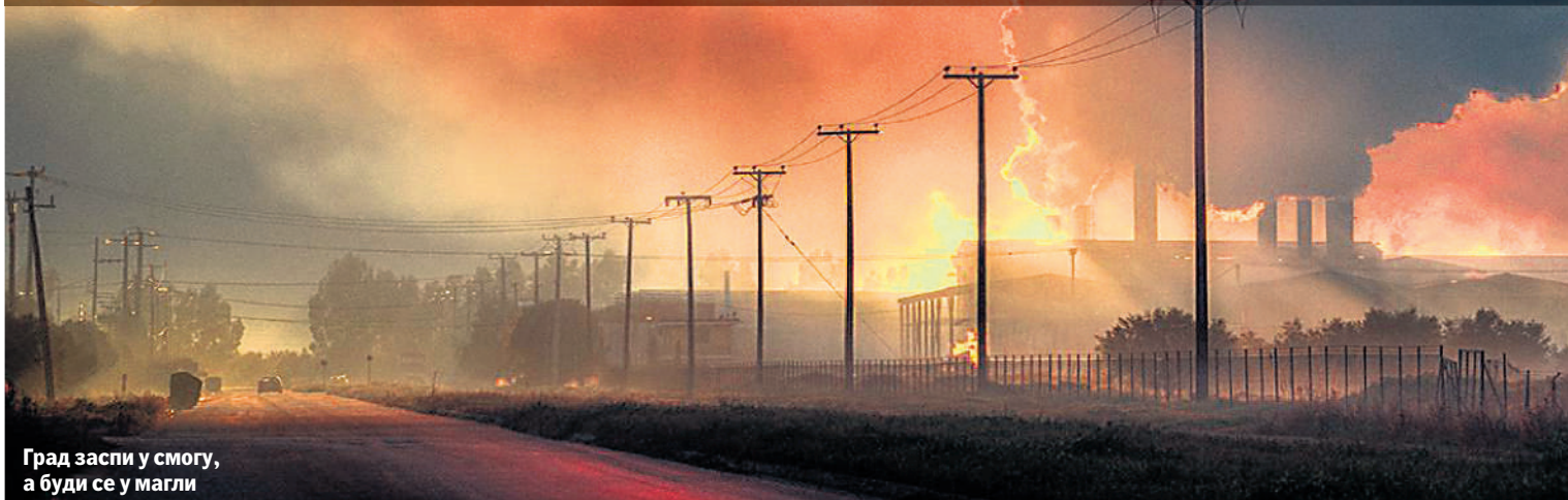
Град заспи у смогу, а буди се у магли