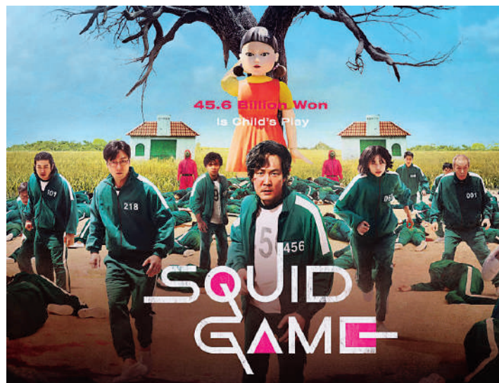
Сви су причали о шокадној серији Сквид гејм

тходног. Победник игре био је наравно измишљени лик, који је стекао огромно богатство, али је на крају остао сам. Јасна је порука ове серије, у животу не можемо све да имамо, али ако изгубимо своје пријатеље, ако изгубимо себе, ништа нам не значи ни слава ни богатство.