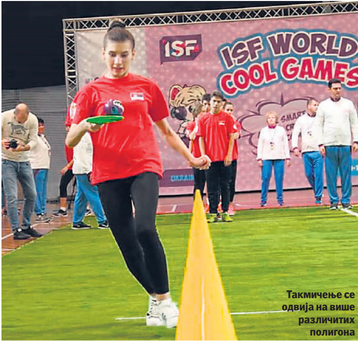
Такмичење се одвија на више различитих полигона

НАЈЗАНИМЉИВИЈИ ДЕО ТАКМИЧЕЊА БИО ЈЕ КАДА ЈЕ ЧЛАН НАШЕГ ТИМА ПРИЛИКОМ ДЕМОНСТРАЦИЈЕ ПОЛИГОНА СТАО НА МЕСТО ГЛАВНОГ СУДИЈЕ И ИМИТИРАО ГА