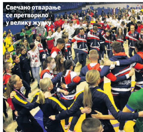
Свечано отварање се претворило у велику журку