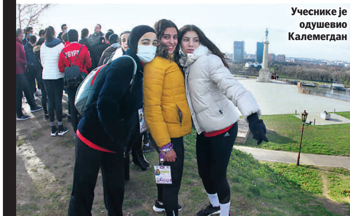
Учеснике је одушевио Калемегдан