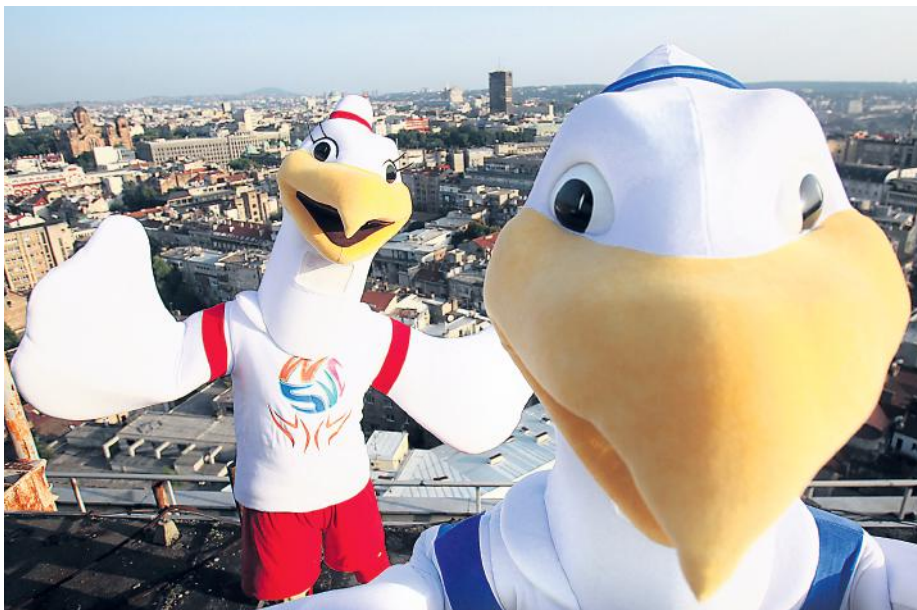
СМЕЧИ И БЛОКИ ОБЕЋАВАЈУ НЕЗАБОРАВАН ПРОВОД НА ШКОЛСКОМ СВЕТСКОМ ПРВЕНСТВУ