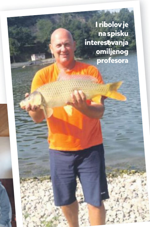
I ribolov je na spisku interesovanja omiljenog profesora