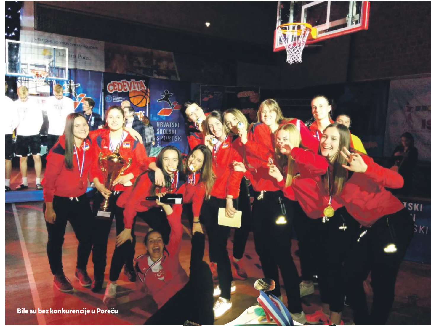
Bile su bez konkurencije u Poreču

dom garantovale Srbiji medalju. A onda je došao i dan finalne borbe, dan zbog kog smo se našle u Poreču.