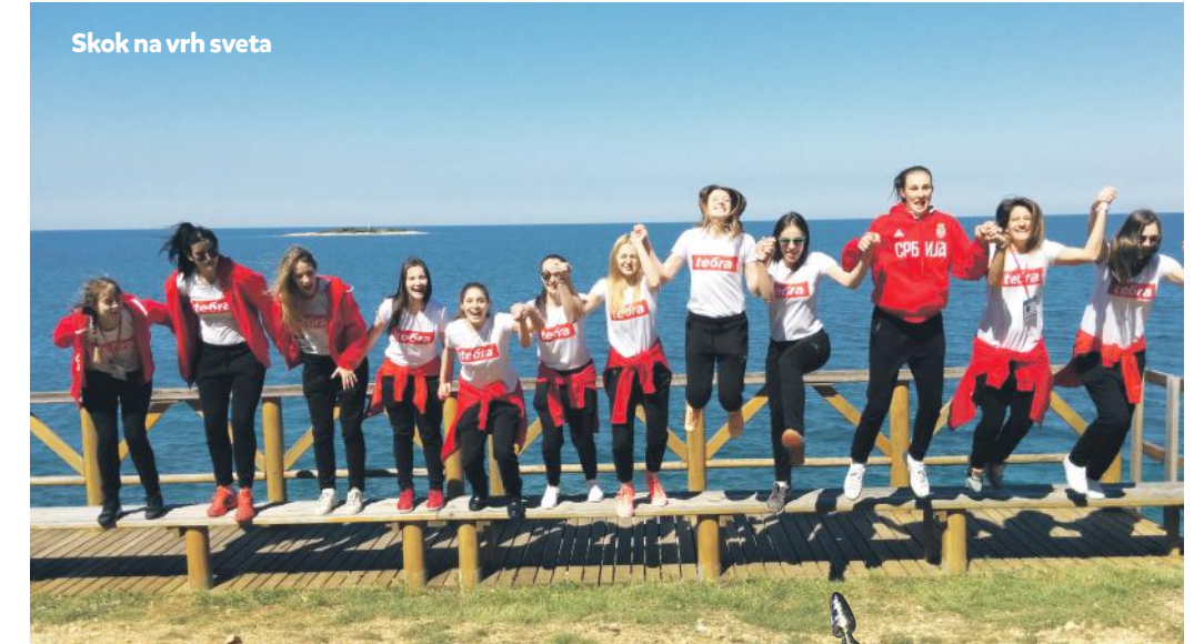
Skok na vrh sveta